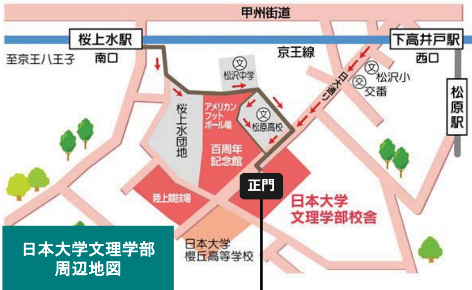
日本大学文理学部 周辺地図